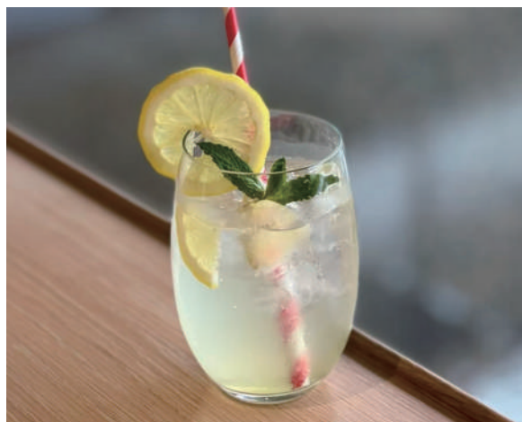
レモンスカッシュ Lemon squash 750円 (税込)