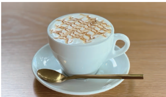
カフェキャラメル (HOT) Cafe caramel 800円 (税込)