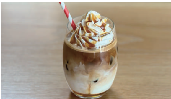
カフェキャラメル (ICE) Cafe caramel 800円 (税込)