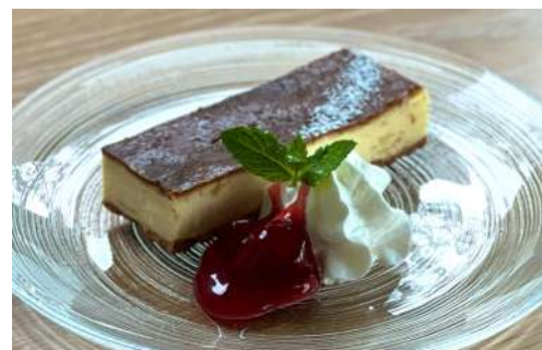
チーズケーキ ドリンクセット ¥1300 / 単品 ¥800