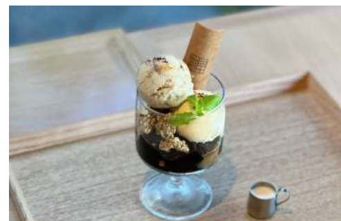
Coffee jelly sundae