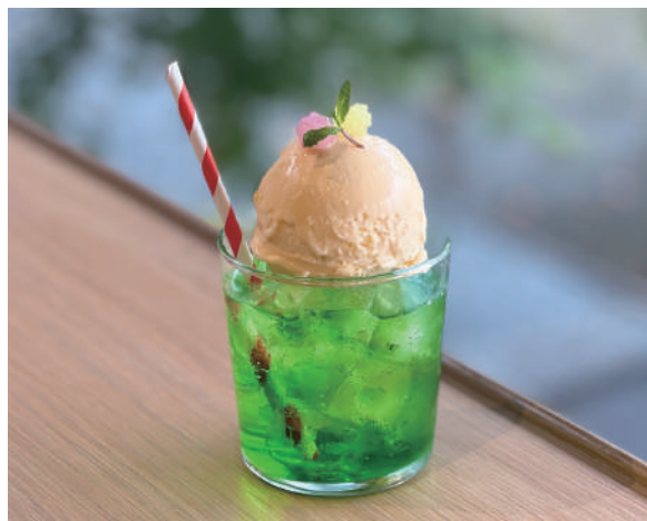
クリームソーダ Cream soda 750円 (税込)