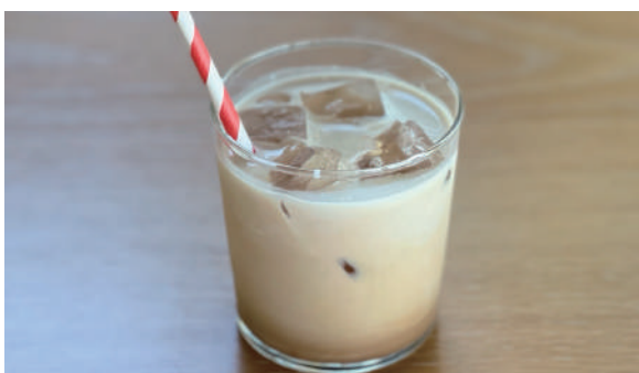
ロイヤルミルクティー (ICE) Royal milk tea 800円 (税込)