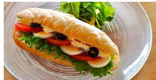
Anchovies and boiled eggs