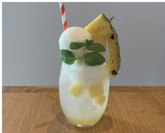
パイナップルクリームソーダ Pineapple cream soda 800円 (税込)