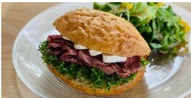
Beef pastrami and camembert