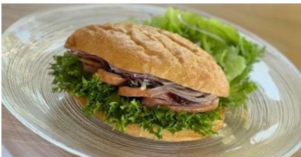
Duck meat teriyaki sauce panini