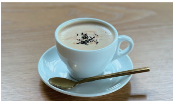
ロイヤルミルクティー (HOT) Royal milk tea 800円 (税込)