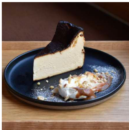
バスクチーズケーキ Basque Cheesecake