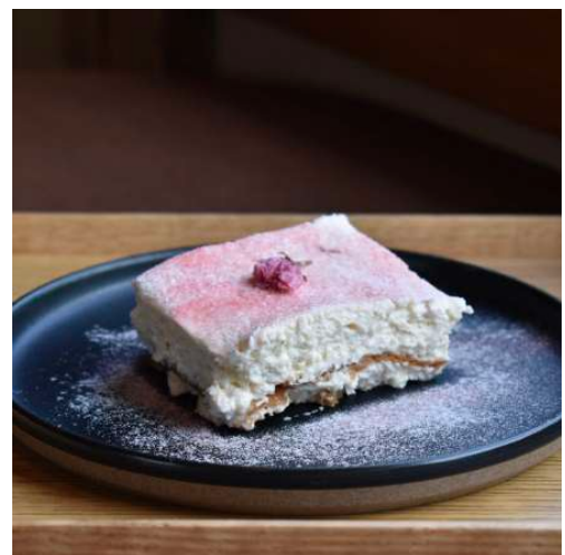
さくらのティラミス SAKURA Tiramisu