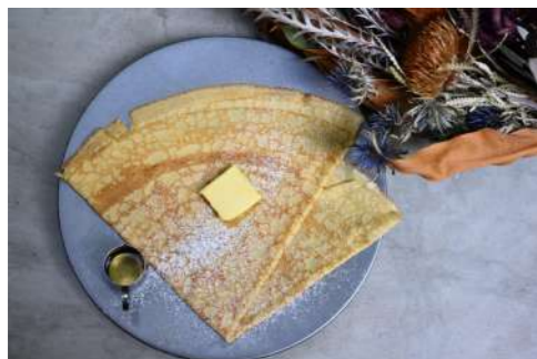
蜂蜜とバターシュガー ¥900