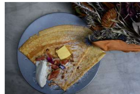
いちじくと マスカルポーネクリーム ¥1300