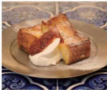
フレンチトースト ¥850- French toast