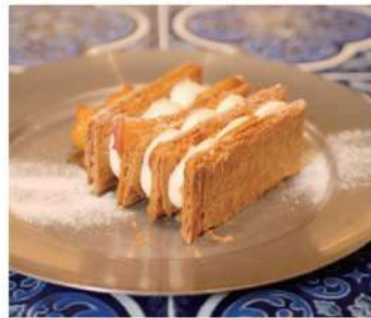
ミルフィーユ ¥850- Millefeuille