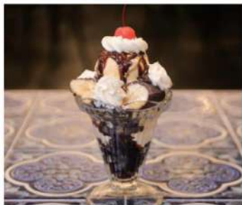
チョコバナナパフェ ¥850- Chocolate banana parfait