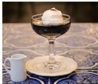
コーヒーゼリー ¥550- Coffee jelly