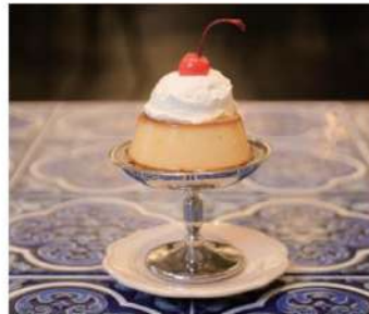
プリン ¥550- Pudding