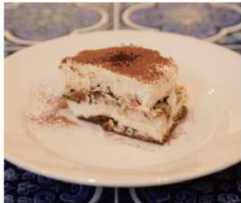
ティラミス ¥600- Tiramisu